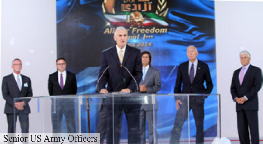
Senior US Army Officers