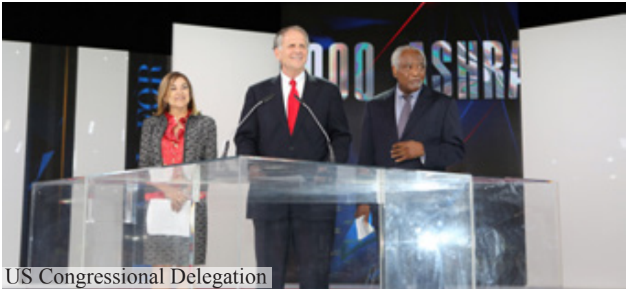
US Congressional Delegation