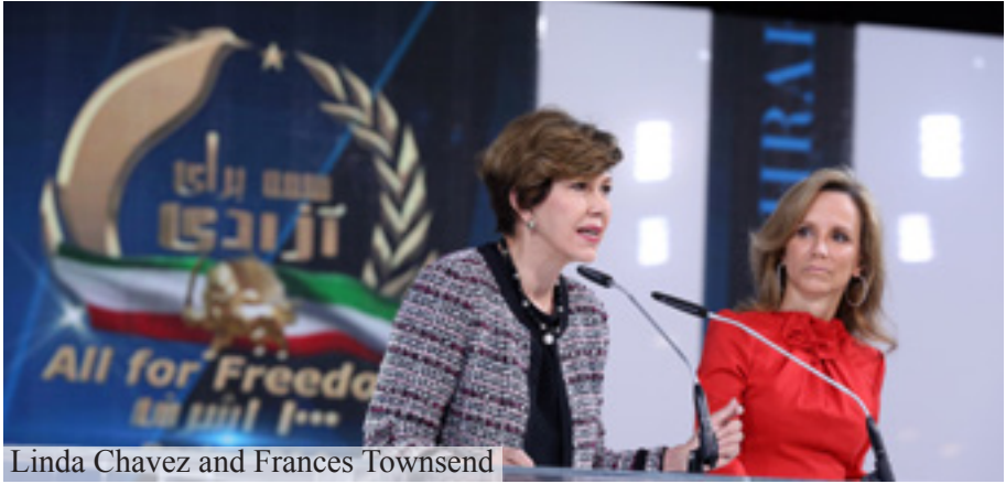
Linda Chavez and Frances Townsend