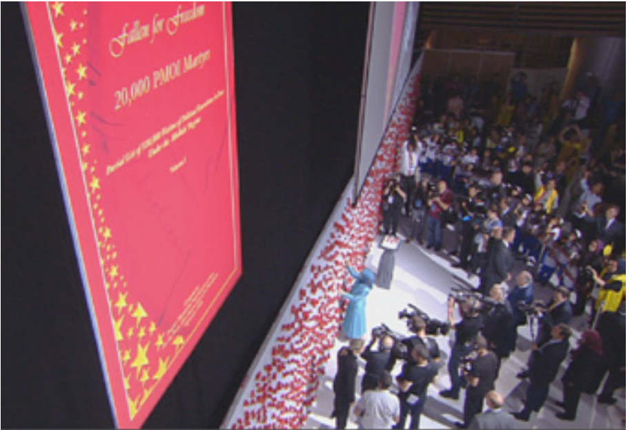
Paying Homage to Martyrs of Iranian Resistance