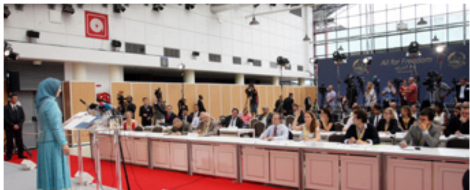
Maryam Rajavi in press conference before the gathering