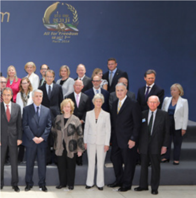
Maryam Rajavi with prominent international personalities attending in grand gathering of Iranians Paris on June 26, 2014