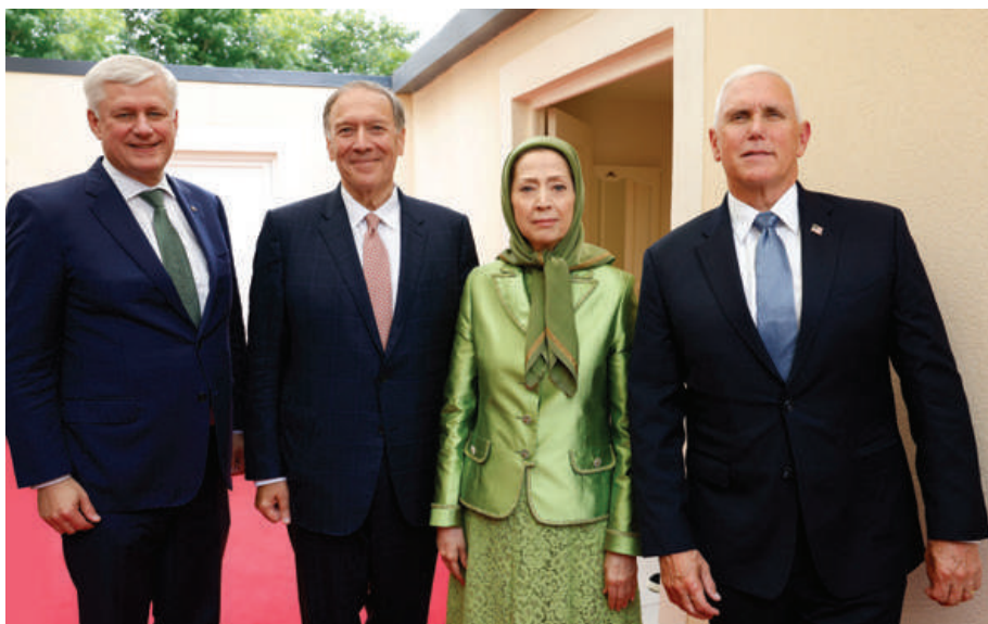
از راست: مایک پنس، مریم رجوی، مایک پمپئو و استفان هارپر