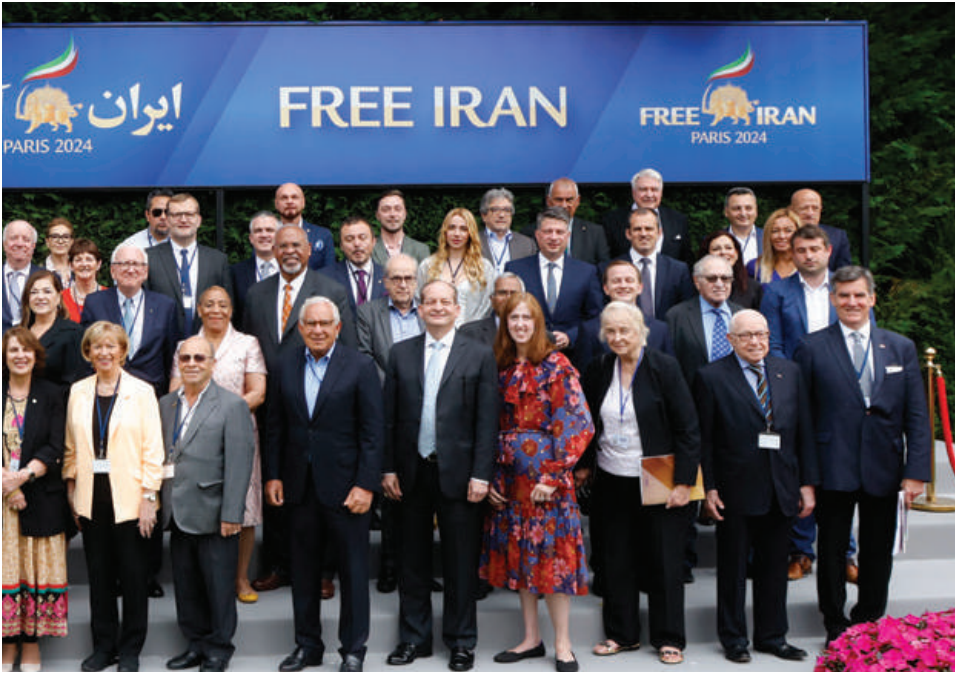
همراه با شخصیت‌های شرکت‌کننده در دومین روز اجلاس جهانی ایران آزاد