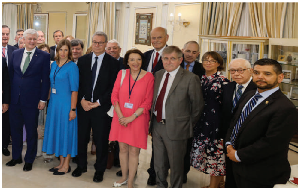
همراه با شخصیت‌های شرکت‌کننده در روز اول اجلاس جهانی ایران آزاد - ۲۰۲۴