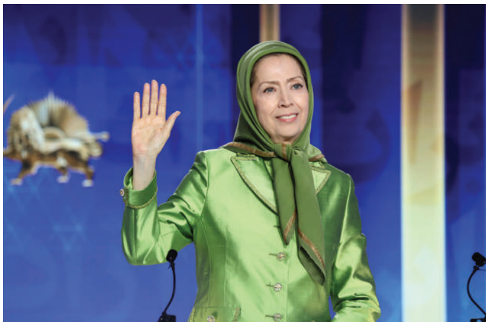
مریم رجوی در نخستین روز گردهمایی جهانی ایران آزاد - ۲۰۲۴ - پاریس