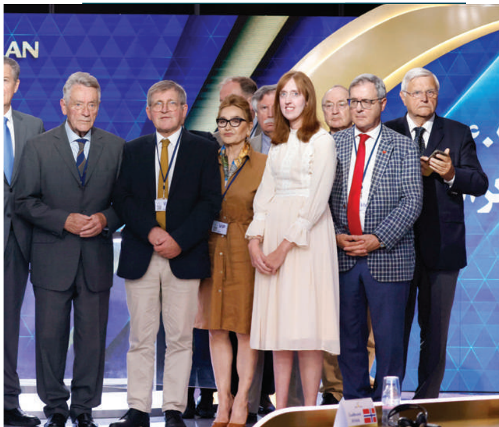
همراه با شخصیت‌های شرکت‌کننده در سومین روز اجلاس جهانی ایران آزاد - ۴۲۰۲