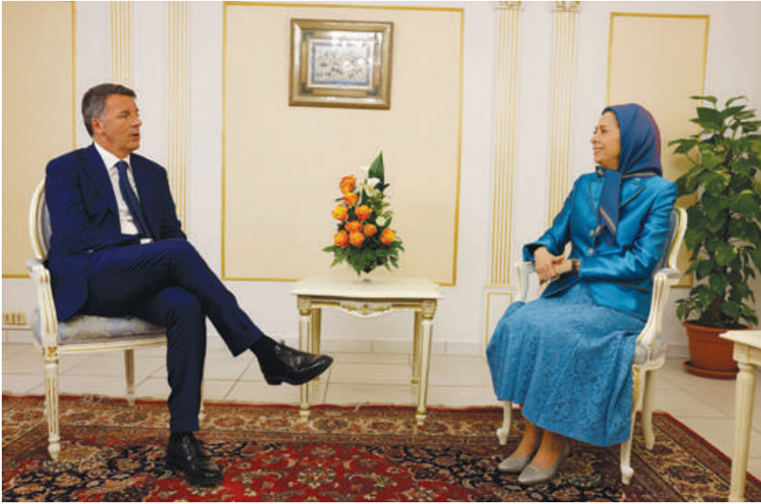
دیدار با ماتئو رنتسی نخست وزیر پیشین ایتالیا