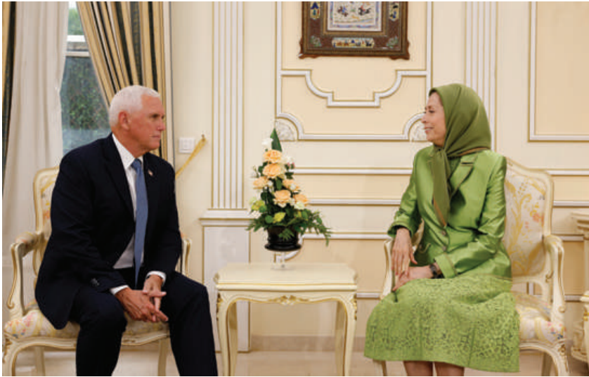
دیدار با مایک پنس، معاون رئیس‌جمهور آمریکا تا سال ۲۰۲۱