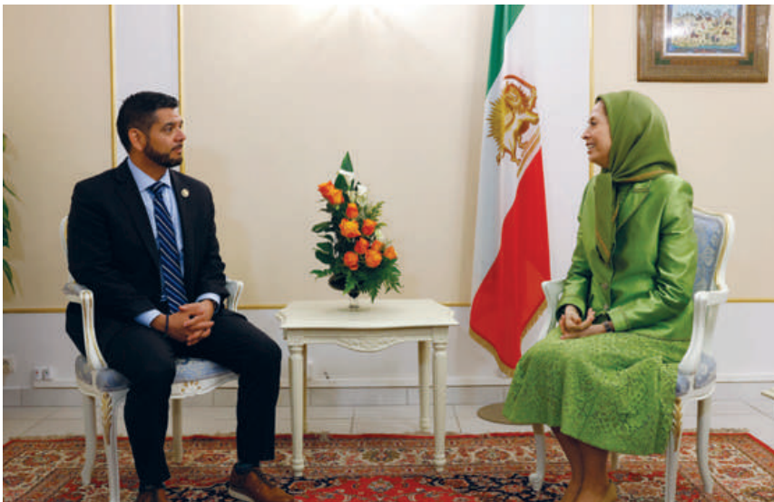
دیدار با راثول روییز-نماینده کنگره آمریکا