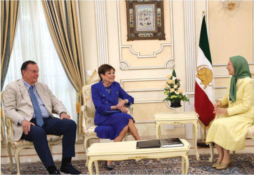
دیدار با ژنرال جیمز جونز مشاور امنیت ملی اوباما و دایان جونز