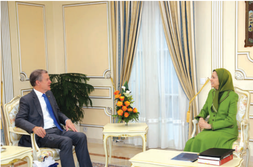
دیدار با سناتور سم براون بک، سفیر سابق آمریکا برای آزادی مذاهب