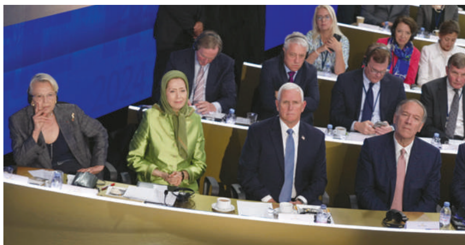
ردیف اول از راست: مایک پمپئو، مایک پنس، مریم رجوی، میشل آلیو ماری ردیف دوم: دیوید جونز، جان برد، جان برکو، آندا کنی