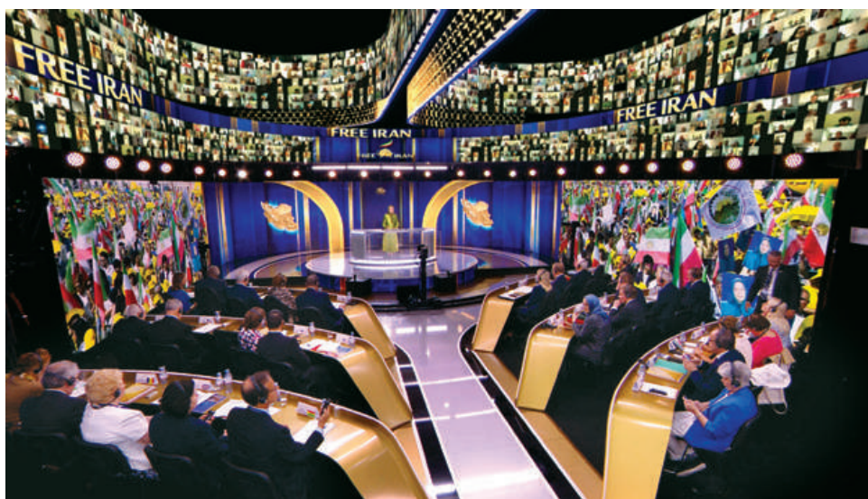
گردهمایی جهانی ایران آزاد - ۲۰۲۴ - پاریس