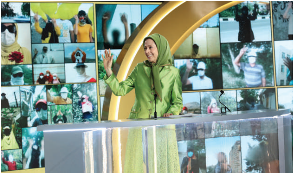
تصاویری از ۲۰۰۰۰ پراتیک انقلابی توسط کانون‌های شورشی در استقبال از کهکشان ایران آزاد