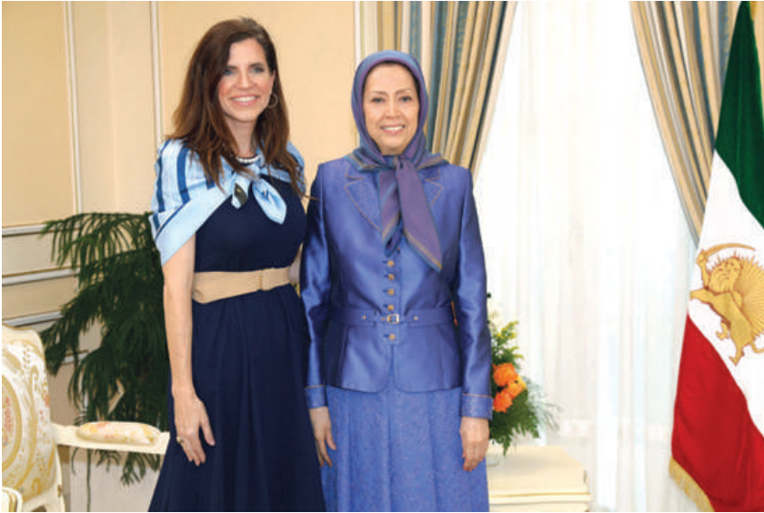
دیدار با نانسی میس، نماینده کنگره آمریکا