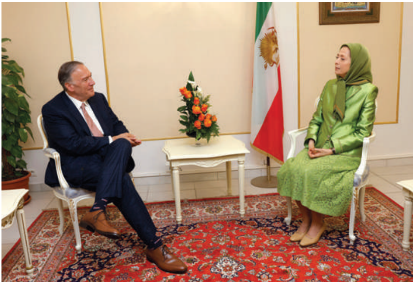
دیدار با مایک پمپئو وزیر خارجه پیشین آمریکا