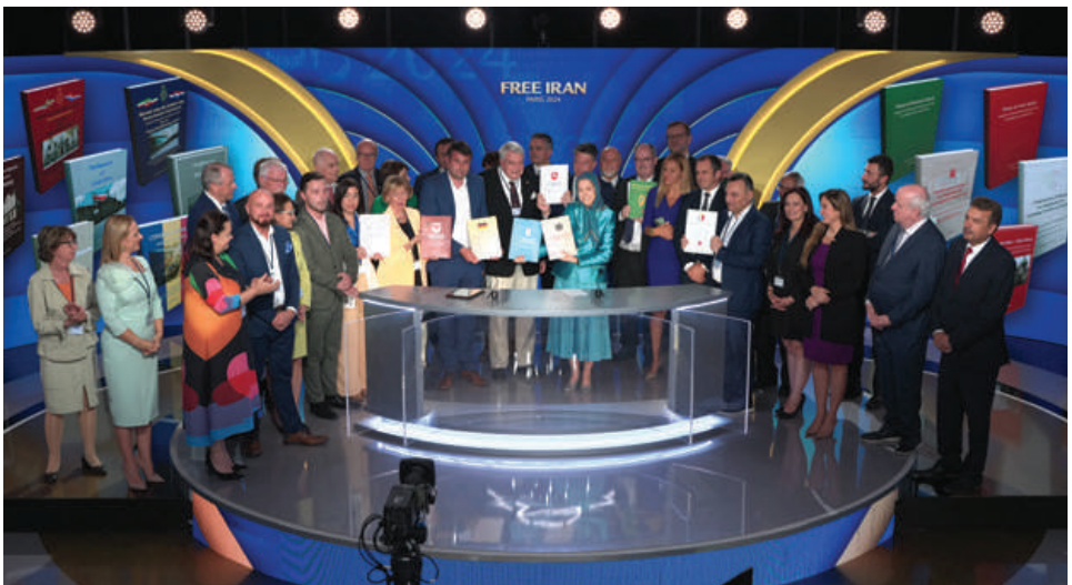
اهدای بیانیه‌های ۴۰۰۰ پارلمانتی، از ۸۴ پارلمان در ۵۰ کشور جهان شامل اکثریت ۳۴مجلس قانون‌گذاری در حمایت از آزادی و مقاومت در ایران به مریم رجوی