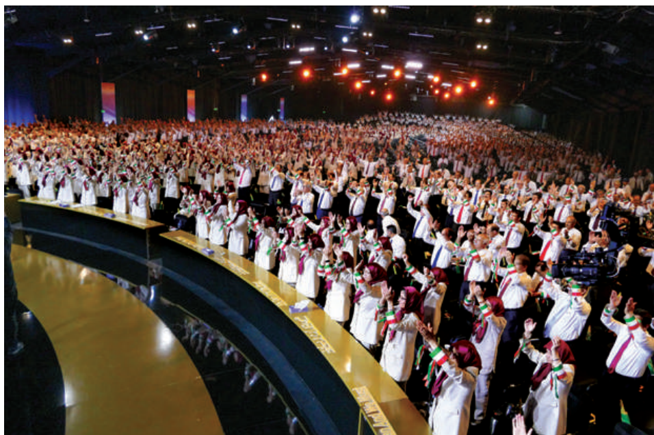
گردهمایی جهانی ایران آزاد - ۲۰۲۴ - اشرف ۳ آلبانی