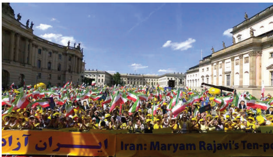
گردهمایی جهانی ایران آزاد - ۲۰۲۴ - تظاهرات بزرگ ایرانیان در برلین