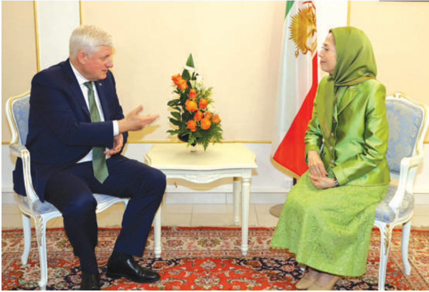
دیدار با استفن هارپر نخست‌وزیر پیشین کانادا